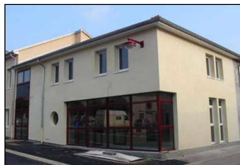
Le bâtiment après travaux

Leur réalisation a permis à la Communauté de Communes d'assurer un meilleur accueil du public, dans des locaux agréables et fonctionnels.