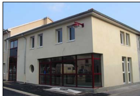
Le bâtiment après travaux

Commune de Domjevin : Rénovation de la salle des fêtes (225 000 €HT de travaux)