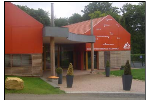
La maison intercommunale de l'enfance